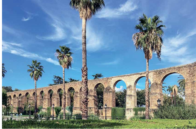
Römisches Äquadukt in Plasencia