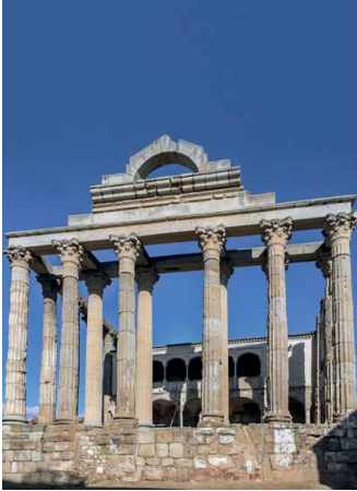
Diana-Tempel in Mérida