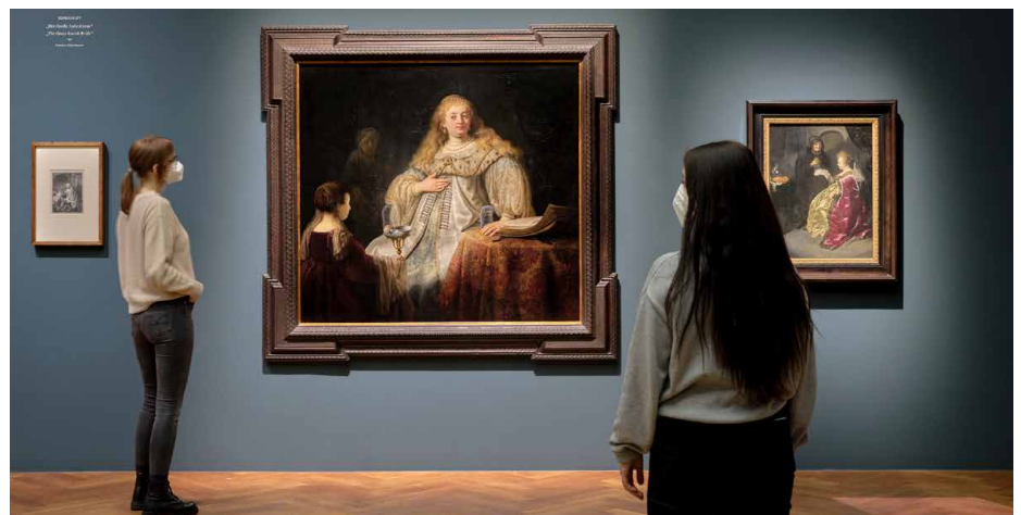
Ausstellung «Nennt mich Rembrandt» im Städel Museum

Im chronologischen Verlauf dieser kleinen Reise versetzen wir uns in die Klassische Moderne und schenken unsere Aufmerksamkeit der wunderbaren Künstlerin Paula Modersohn-Becker in der Schirn-Kunsthalle. Im Laufe des Nachmittages verlassen wir Frankfurt und reisen zurück nach Zürich.