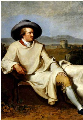
Tischbein, «Goethe in Campania»